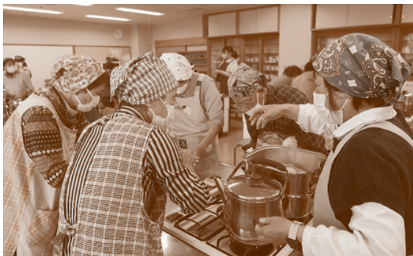
3日目の実習の様子(池田町)

上の写真は、小谷村で行った実習の様子です。小谷村では、認知症オレンジカフェ「ほっこりカフェ」に参加しました。 「ほっこりカフェ」は、誰もが気軽に出かけ集える場、お互いを理解し合う場所として、年数回行われています。 今回は参加者でお好み焼きを作ってお食べました。