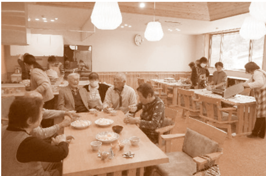
3日目の実習の様子(小谷村)

ルパーとして働いている方に加わっていただきグループワークを行い、買い物や調理、洗濯、掃除等の方法やコツについて活発なやり取りを行っていました。実際に現場で働いている方のお話を聞いて、普段の生活での家事とはまた違った配慮が必要ということを教えてくださいました。 3日目はお住まいの市町村ごとに分かれて、実習を行いました。実習では、実際に支えあい活動を行っている団体の方と交流を行ったり、研修に参加している方同士で親睦を深めたりしていただきました。