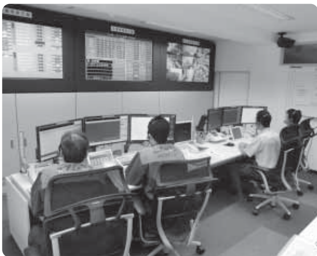
消防本部通信指令室

※聴覚及び言語に障がいをお持ちの方へ ファクス119・メール119番通報の利用登録は、随時受付しています。詳しくは北アルプス広域消防本部のホームページをご覧ください。