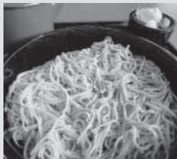
★ざるそば (500円) がおすすめ!

期間 11月9日～11月14日 営業 12:00～15:00、 17:00～20:00 電話 75-3880