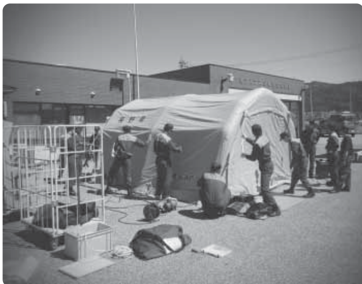
テント設置訓練の様子

これまで、緊急消防援助隊や長野県相互応援隊などの大規模訓練のほか、御岳山噴火災害での長野県相互応援隊活動の際に活用しています。これらの資機材は、緊急時に支障なく使えるよう、救助隊を中心に定期的に保守点検を行っています。