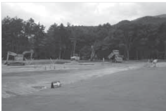
9月中旬の建設現場

写真には9月中旬の建設現場の様子です。この日は土砂の搬入と盛土の締固めが行われていました。エコパークの建設地では、河川がすぐ近くにあるため、万が一河川が氾濫しても施設が浸水しないよう、盛土をしっかり行っています。そのため、盛土に使う土砂の量は約28,000m 3 となり、造成工事が完了するまでに多くのダンプが通行することになります。工事車両の運行予定につきましては、毎月ホームページに掲載していますのでご覧ください。今後も工事に伴い周辺道路を大型車両が通行いたします。周辺地域の皆様には、ご迷惑をおかけいたしますがご理解とご協力をお願いいたします。