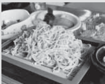
★新田地区の地粉100%のお蕎麦をお召しあがりください。

期間 11月11日～11月12日 営業 11:00～13:00、 17:00～20:00 電話 72-2201 (ファミリー若田)