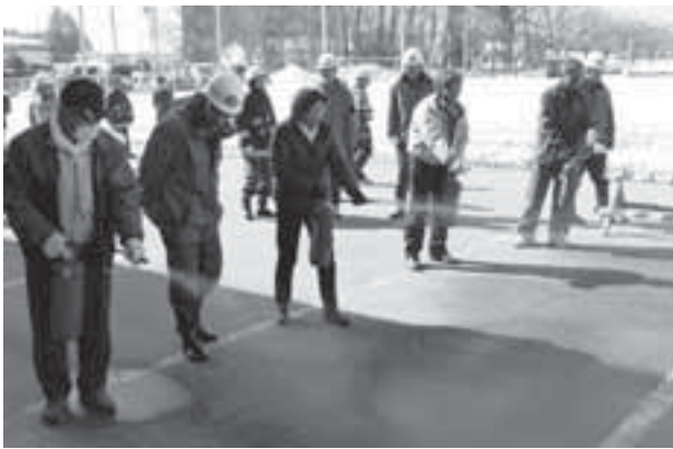
初期消火訓練のようす

「消火ブース」では消火器を使った初期消火訓練や煙ハウスによる煙の体験。「救助ブース」では身近にある物を使って重量物を持ち上げる訓練。「救急ブース」では応急手当による止血や固定の方法、また、突然呼吸や心臓が止まってしまった時に行う心肺蘇生法の体験等を行いました。