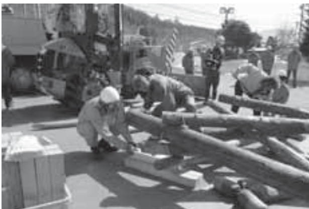
重量物を持ち上げる訓練のようす