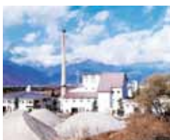
大町市環境プラント