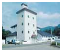
白馬山麓清掃センター